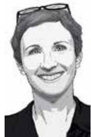
ÍRTA: FEKETE EMESE

Kling dédapa csaknem száz évvel ezelőtt megnyitott apró kovácsműhelye apáról fiúra szállva élt át háborút, szocializmust, rendszerváltást, és nőtt milliárdos forgalmú